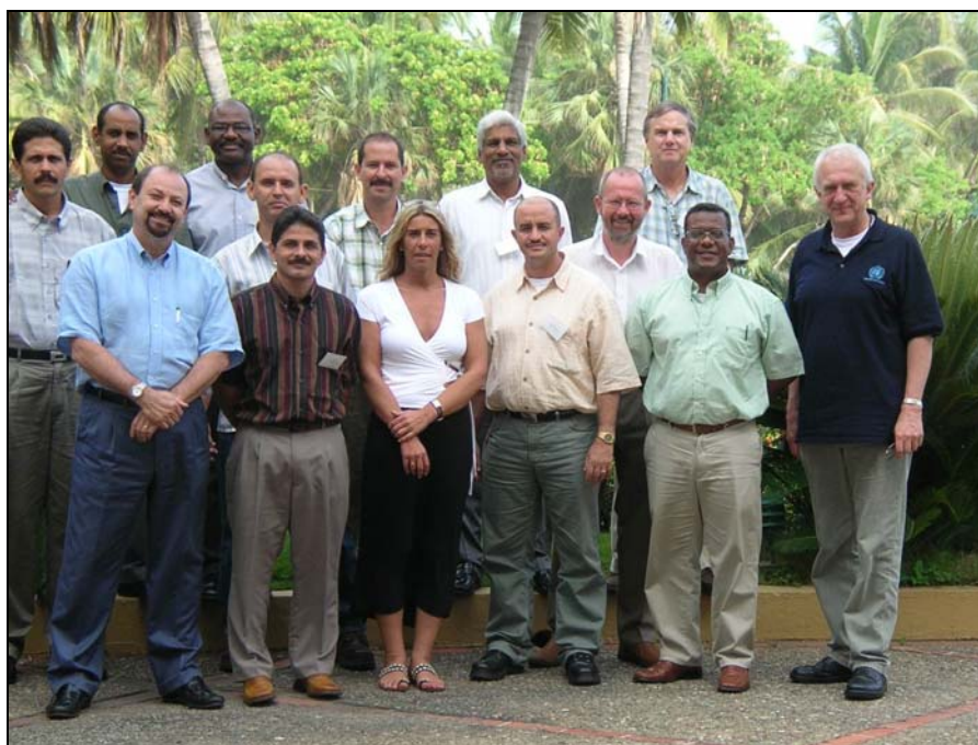
Participantes de Taller Técnico Subregional del Caribe que incluye representantes de Cuba, Jamaica, República Dominicana, y Trinidad & Tobago, así como de la FAO RLC y del GFMC.